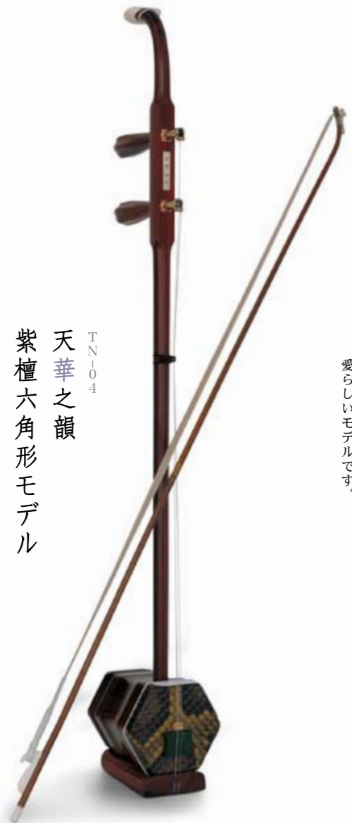
TN104 天華之韻 紫檀六角形モデル

最上級黄皮、稀少な紫檀を使用して つくりあげた紫檀六角形タイプ。 最高の技と素材が出会った逸品、 明るく軽やかな音色を生み出します。