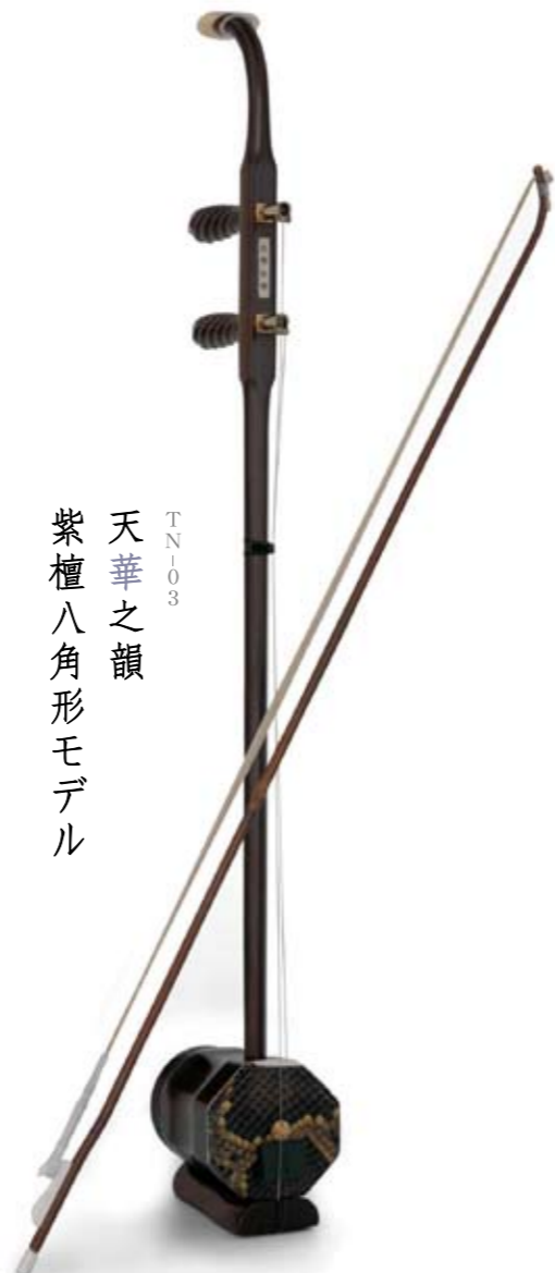
TN103 天華之韻 紫檀八角形モデル

最上級黄皮、稀少な紫檀を使用して つくりあげた紫檀六角形タイプ。 最高の技と素材が出会った逸品、 明るく軽やかな音色を生み出します。