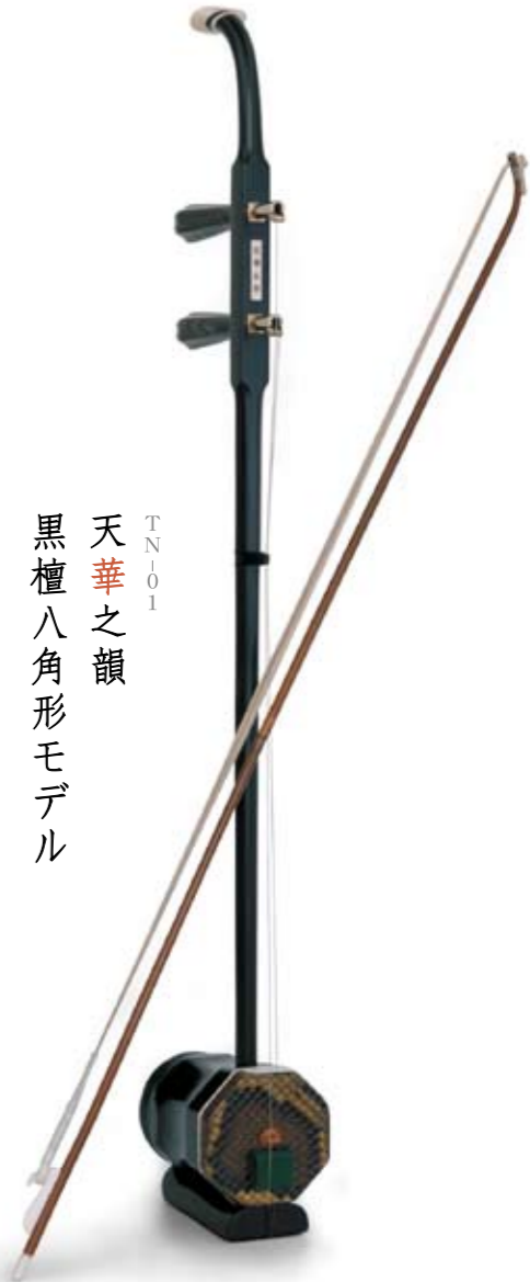
TN101 天華之韻 黒檀八角形モデル

冴えわたる透明感のある音色が 魅力の黒檀六角形タイプ。 多くの著名演奏家に愛され続ける 人気のモデルです。