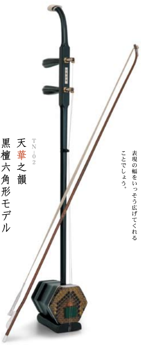
TN102 天華之韻 黒檀六角形モデル

使い込むごとに深みを増していく 紫檀八角形タイプ。 柔らかい音色に、糸巻部分の麻花仕上げが 愛らしいモデルです。